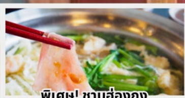
พิเศษ! ชาบูฮ่องกง