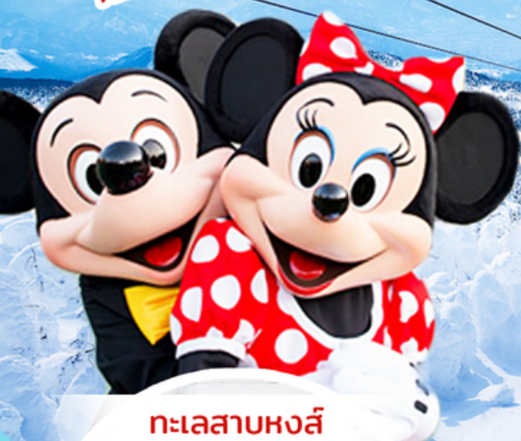
ทะเลสาบหงส์