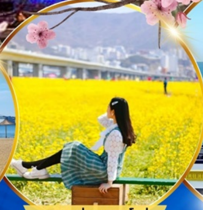
เทศกาลทุ่งดอกคาโนล่า