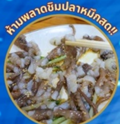
ห้ามพลาดชิมปลาหมึกสด!!

ชมซากุระจุใจ เทศกาลจีนแฮ ชมดอกคามิเลียที่เกาะดองแบกโซม แวะถ่ายรูปทุ่งดอกคาโนล่า เหลืองอร่าม นั่งเคเบิลคาร์ ชมทะเลปูซาน ห้ามพลาด!! ตลาดปลาที่ใหญ่ที่สุด เซคอินแหล่งสุดชิค The Bay101 ช้อปปิ้งตลาดพื้นเมือง อิสระช้อปปิ้งได้ดิน ชมยอน Lotte Duty Free