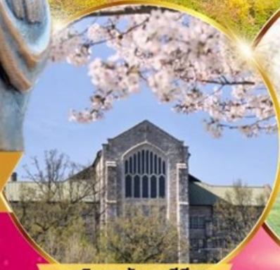
มหาวิทยาลัยสตรีอีฮวา