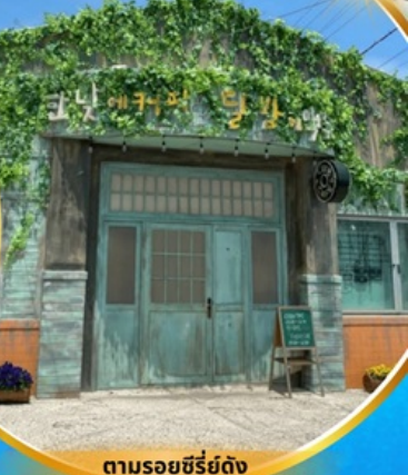
ตามรอยซีรีส์ดัง Hometown chachacha