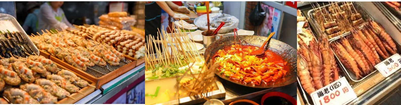
เที่ยวเพลิน แคมอัมท็อง

ให้ท่านอิสระ ที่ตลาดแฮอินแด แหล่งช้อปปิ้ง สุดฮิต เกาหลี เกาหลี เป็นตลาดแห่งเดียวของเกาหลีใต้ที่ตั้งอยู่ใกล้ชายหาดแฮอินแด ซึ่งถือว่าเป็นชายหาดที่มีชื่อเสียงมากที่สุดในประเทศเกาหลีใต้ เพราะชาวเกาหลีนิยมมาเที่ยวในฤดูร้อน เป็นถนนสายเล็กๆ มีร้านอาหารเปิดขายของตั้งแต่เช้าจนถึงช่วงดึก ตลาดแห่งนี้ยิ่งดึกยิ่งคึกคัก นักท่องเที่ยวนิยมไปเดินชิว ภายในตลาดมีความสะอาดอ่าน มีร้านค้าพร้อมป้ายสัญลักษณ์ที่มีมาตรฐาน มีร้านจำหน่ายอาหารพื้นบ้านให้ได้ลิ้มลอง รสชาติ มีร้านค้าที่จำหน่ายผลิตภัณฑ์ที่หลากหลาย แปลกตา แล้วก็ต้องมีร้านอาหารทะเลสดๆ เพราะใกล้แหล่ง มีแผงขายอาหารแบบสตรีทฟู้ด ร้านอาหารให้เลือกรับ และร้านค้าจำหน่ายขนมของฝากท้องถิ่น เรียกได้ว่า เดิน