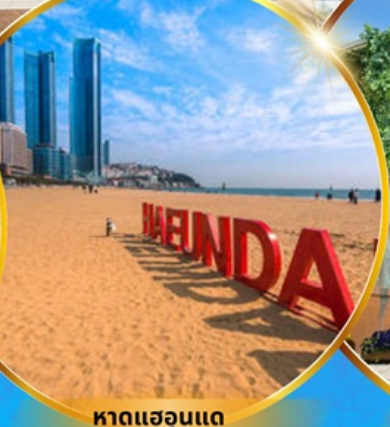
หาดแฮนแด