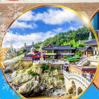
วัดแสงยงคุงซา