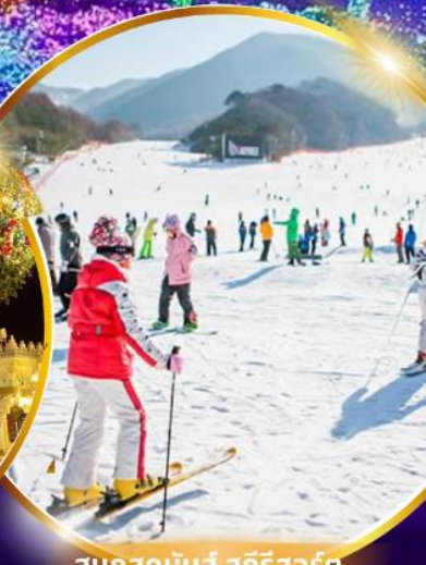
สนุกสุดมันส์ สกีรีสอร์ท

ชมจอ LED ขนาดยักษ์ที่รีสอร์ท 5 ดาว ใหญ่ที่สุดในเอเชียเหนือ สัมพัสมะสกีรีสอร์ท สนุกสุดมันส์ สวนสนุกเอเวอร์แลนด์ ชมพระราชวังคยองบกคุง ย้อนอดีตหมู่บ้านบุคซอน อันอก อิสระช้อปปิ้งคังนัม Lotte Duty Free