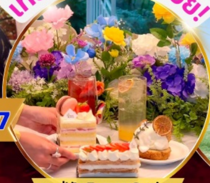
คาเฟ่ดัง Forest Outing