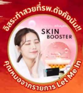
อิสระทำสวยที่พ.ดังคังนัม! คุณหมอจรรยาภาส Let Me In

ที่เที่ยวใหม่ล่าสุด รีสอร์ท 5ดาว ใหญ่ที่สุดในเอเชียเหนือ แวะคาเฟ่ดัง เปลี่ยนธีมสวยตามเทศกาล เข้าชมถ้ำอดีตเหมืองทอง คล้องใจที่กุญแจ โซล ทาวเวอร์