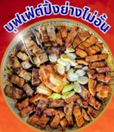
บุฟเฟ่ต์ปิ้งย่างไม่เว้น