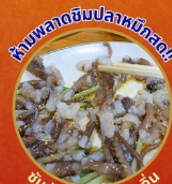
ชั้นนักจ๊อ อาหารท้องถิ่น

โพฮังสเปซวอล์ค สกายวอร์ค ตามรอยซีรีส์ Hometown chachacha ถ่ายรูปชิคๆ หมู่บ้านวัฒนธรรมคิมซอน ขึ้นเคเบิ้ลคาร์ ชมทะเลปูซาน นั่งรถไฟปูคปิก sky capsule ชิมของอร่อยตลาดแฮอนแด แหล่งช้อปปิ้งใต้ดิน ชิมยอน อิสระช้อปปิ้ง Lotte Duty Free