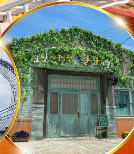
ตามรอยซีรีส์ดัง Hometown chachacha

โพฮังสเปซวอล์ค สกายวอร์ค ตามรอยซีรีส์ Hometown chachacha ถ่ายรูปชิคๆ หมู่บ้านวัฒนธรรมคิมซอน ขึ้นเคเบิ้ลคาร์ ชมทะเลปูซาน นั่งรถไฟปูคปิก sky capsule ชิมของอร่อยตลาดแฮอนแด แหล่งช้อปปิ้งใต้ดิน ชิมยอน อิสระช้อปปิ้ง Lotte Duty Free