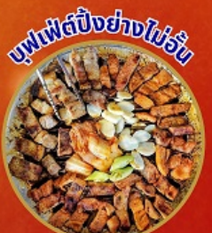
บุฟเฟต์ปิ้งย่างไม่อั้น