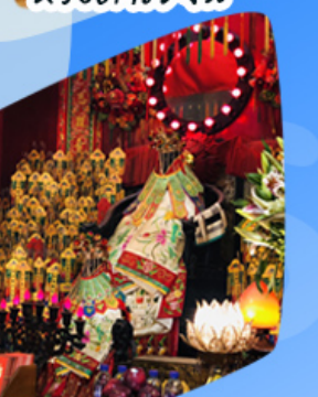
เจ้าแม่กวนอิมขี้มเงิน