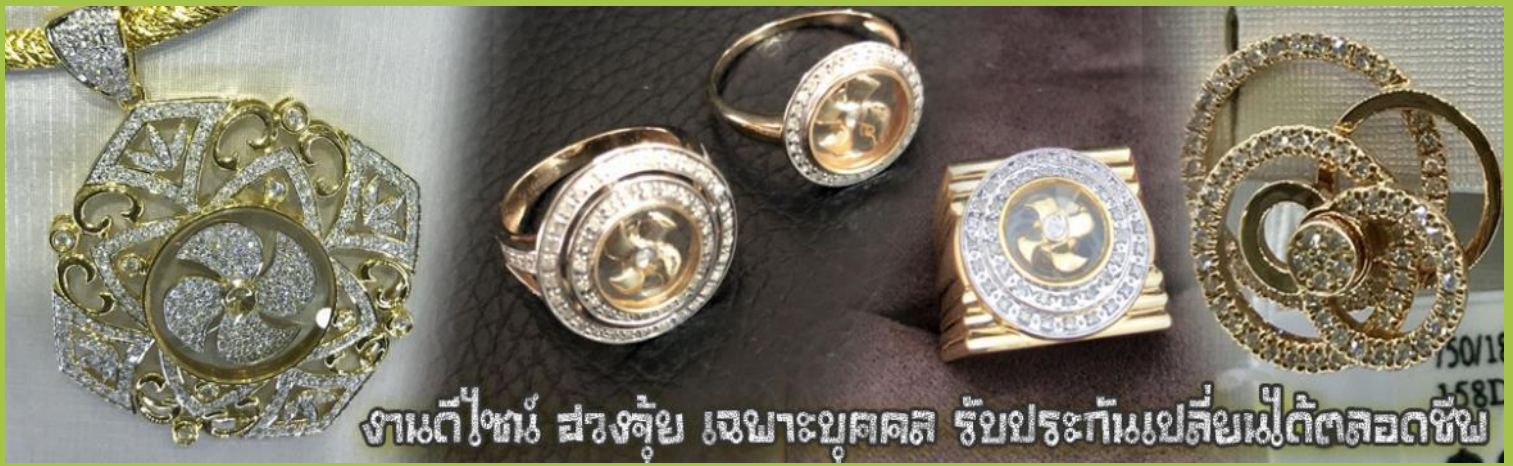
งานดีใจ ฝรั่งซื้อ เมฆาบุคคล รับประกันเปลี่ยนไม่ตัดยอดชีพ

จากนั้นนำท่านสู่ ร้านหยก ชมความงามปีเซียะ ที่เชื่อกันว่าเป็นวัตถุมงคลลอยดนิมม ที่มีการนำมาบูชา เพื่อให้ช่วยป้องกันสิ่งชั่วร้าย เรียกทรัพย์สินเงินทองให้ไหลมาเทมา และกักเก็บทรัพย์นั้นไม่ให้รั่วไหลออกไปไหนได้ ชาวจีนโบราณเชื่อกันว่า ปีเซียะเป็นสัตว์ประหลาดที่รวมลักษณะของสัตว์มงคลทั้ง 5 ชนิดไว้ด้วยกัน ได้แก่ มังกร พญาราชสีห์หรือสิงโต, อินทรี, กวาง, และแมว โดยตามตำนานเล่าว่า ปีเซียะเป็นลูกมังกรตัวที่ 9 (เทพแห่งโชคลาภ) ของพญามังกรสวรรค์ มีชื่อเรียกด้วยกันหลายชื่อไม่ว่าจะเป็น “เทียนลก (กวางสวรรค์)” เป็นชื่อเดิม ส่วนจีนกวางตุ้งจะเรียกว่า “เผ่ฮ่า” และคนจีนแต้จิ๋วจะเรียกว่า “ผีซิว” และยังมีจำหน่ายยาสมุนไพรบำรุงเพิ่มความแข็งแรงตามความเชื่อของคนฮ่องกง