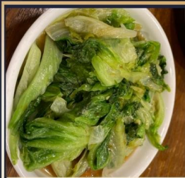
ผัดผักตามฤดูกาล