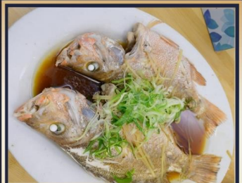
ปลาหนังซีอิ๊ว