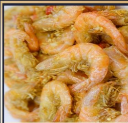
กุ้งทอดกระเทียม