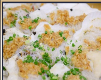
หอยเชลล์อบวุ้นเส้น