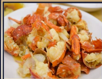
กุ้งมังกรอบซีส