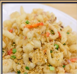
หมึกทอดกระเทียม