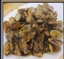
ผัดหอยลาย