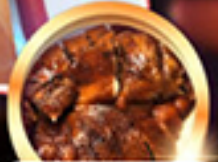
ห่านย่างรสเลิศ