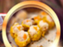
ติ่มซำต้นตำรับ