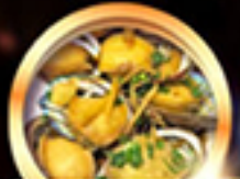
เมนูซีฟู้ดสัญจร