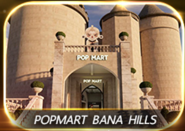
POPMART BANA HILLS

สัมผัสความงามหมู่บ้านฝรั่งเศสที่บานาฮิลล์ ซอปปิง POPMART