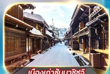
เมืองเก่าชินมาชิซูจิ