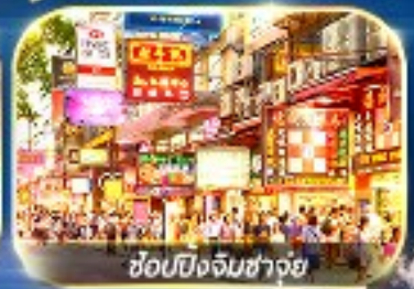
ซุปปิ้งจิมซ่าจู้

เต็มอิ่มทั้ง ไหว้พระบอพร และ ซุปปิ้งแบบจัดเต็ม