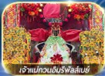
เจ้าแม่ทวนอิมริฟัลส์เบย์