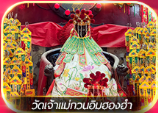
วัดเจ้าแม่กวนอิมสองอ่า