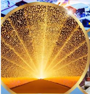
นาบาระ โนะ ซาโตะ