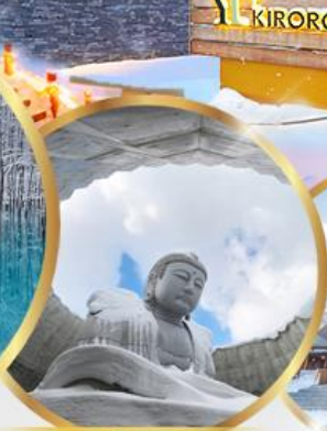
เป็นเขาแห่งพระพุทธเจ้า