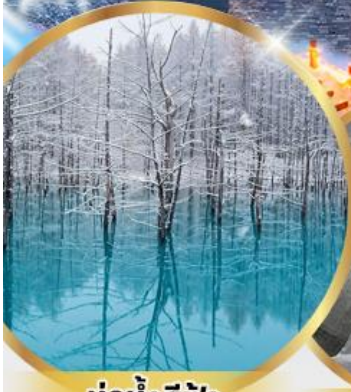
บ่อน้ำสีฟ้า