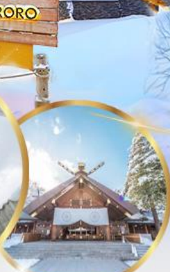
ศาลเจ้าฮอกไกโด