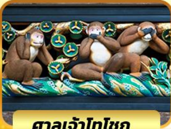
ศาลเจ้าโทโชกุ