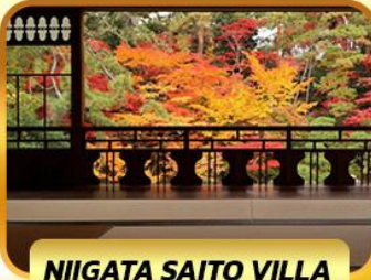
NIIGATA SAITO VILLA