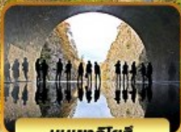
หุบเขาคิโยสึ