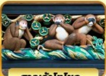
ศาลเจ้าโทโชกุ