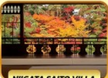
NIIGATA SAITO VILLA