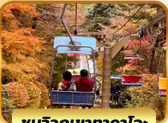
ชมวิวกุเขาทาคาโอะ