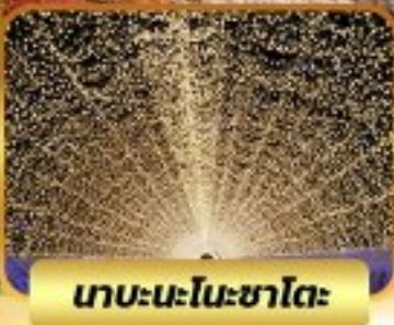
น้ำตกไนเคะซาโตะ