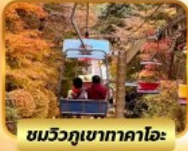
ชมวิวกุเขากาโตะ