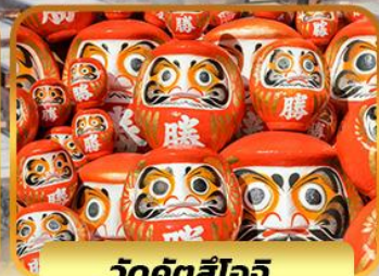
วัดคัตสึโฮจิ