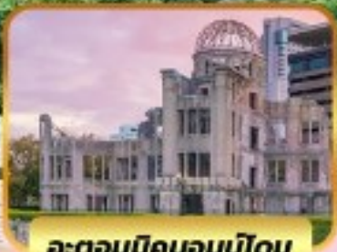
อะตอมบิคมอบบิโดม