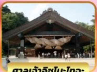
ศาลเจ้าอิซุโมะโทะวะ