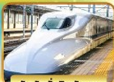
สัมผัสนั่งชินกันเซน