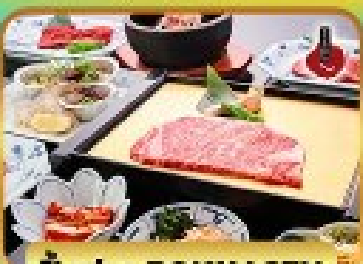
บ๊องย่าง ROKKASEN