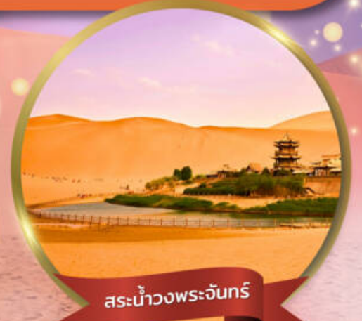
สระน้ำวงพระจันทร์