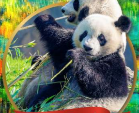
หมีแพนด้าเจียงเยียน