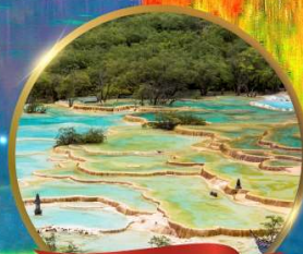
อุทยานหองหลง