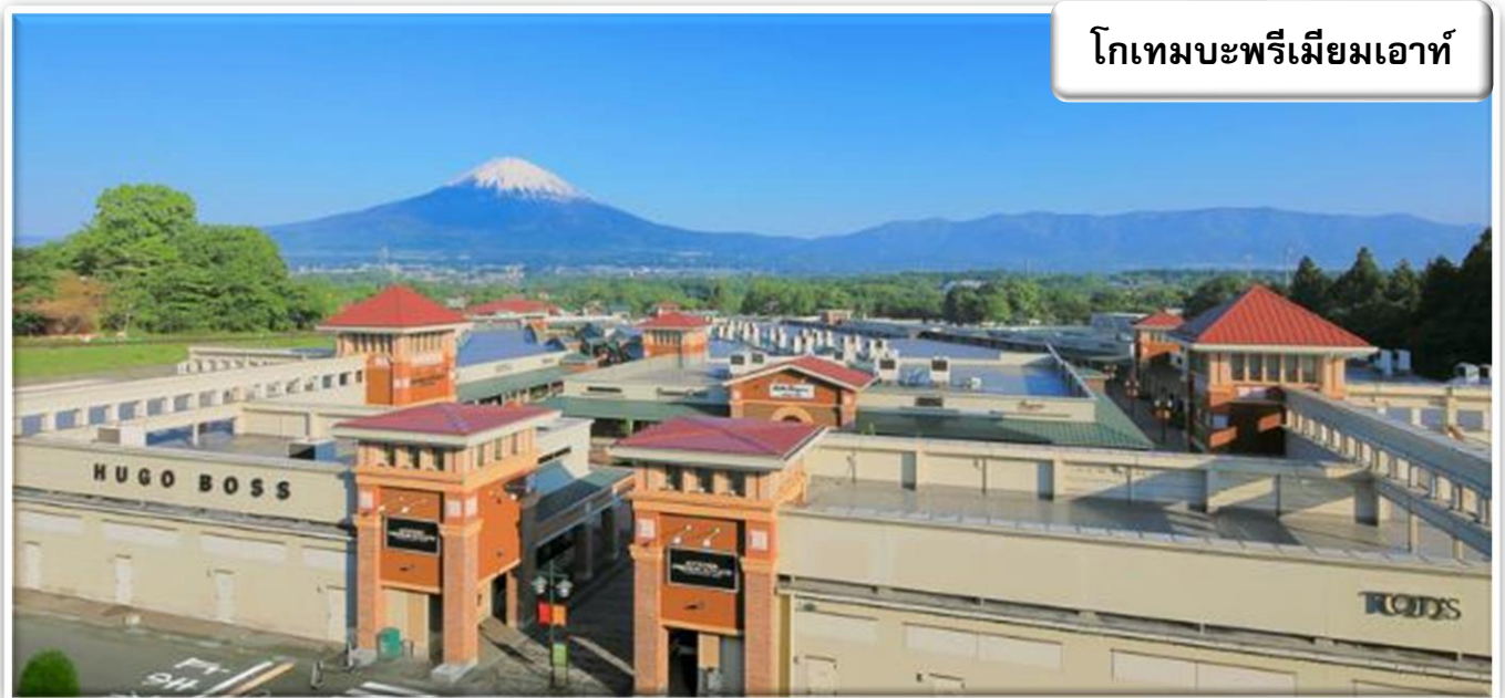
โกเทมบะพรีเมียมเอาท์

สวนดอกไม้ฮามามัตสึ สวนพฤกษศาสตร์ที่อยู่ติดกับทะเลสาบฮามานะ มีทัศนียภาพธรรมชาติที่สวยงามและเต็มไปด้วยดอกไม้พีชพันธุ์กว่า 3,000 ชนิด รวมถึงต้นซากุระ 1,300 ต้น และทิวลิป 5 แสนดอก นอกจากนี้ยังมี "สวนดอกกุหลาบ" กว่า 1000 ต้น และ "สวนฮานะชิโอะ" ที่เต็มไปด้วยพรรณไม้ญี่ปุ่นกว่า 1 ล้านต้น อีกทั้งยังสามารถชมดอกไม้บานาพันธุ์ตามฤดูกาล เช่น ในฤดูใบไม้ร่วงก็สามารถชมโมมิจิ(ใบไม้แดง)ได้