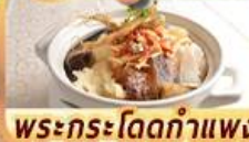
พระกระโดดกำแพง