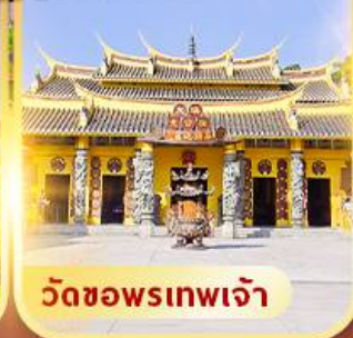
วัดขอพรเทพเจ้า