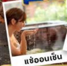
เขื่อนเซ็น