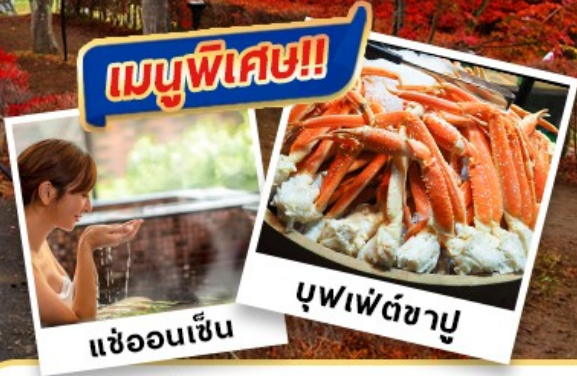
แหว่ออนเซ็น