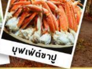
บุฟเฟต์ชาบู