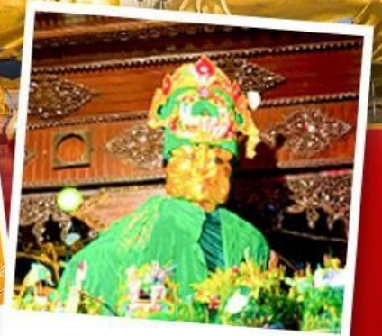
ขอพรแม่ยักษ์