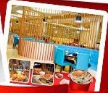
ก๊วยแม่น้ำ + HOTPOT SEAFOOD