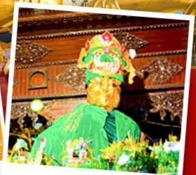
ขอพรแม่ยักยี