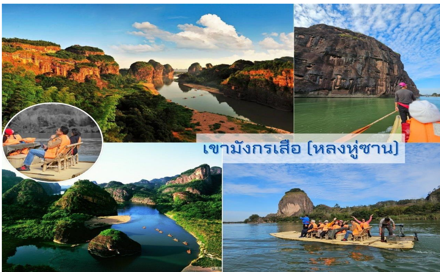
เขามังกรเสือ (หลงหูซาน)

2,200 ปี บนเขาแห่งนี้มีความอุดมสมบูรณ์ทางธรรมชาติ เต็มไปด้วยพืชพันธุ์ ลำธารและน้ำตก อีกทั้งยังถูกปกคลุมด้วยหมอก มีอากาศเย็นสบายเกือบตลอดทั้งปี ทำให้มีบรรยากาศที่งดงามยิ่ง นอกจากนี้ที่นี่ยังเป็นจุดศูนย์รวมที่สำคัญทางวัฒนธรรม การศึกษา การเมือง และศาสนา ได้แก่ ศาสนาพุทธ เต๋า อิสลาม คริสต์นิกายโปรเตสแตนต์ นิกายออร์ทอดอกซ์ และนิกายโรมันคาทอลิก ด้วยการผสมผสานกันอย่างลงตัวของธรรมชาติและวัฒนธรรม ทำให้เขาหลูซานแห่งนี้ได้รับการขึ้นทะเบียนเป็นมรดกโลกเมื่อปี ค.ศ. 1996 และยังได้รับเลือกให้เป็นสถานที่ท่องเที่ยวระดับ 5A ของจีนอีกด้วย นำท่านสู่เขตหินเซียนสุยเหยียน นั่งเรือขึ้น และล่องแพไม้ไผ่แม่น้ำหลูซี ซึ่งมีทัศนียภาพและบรรยากาศสองฟากฝั่งประดุจดังภาพวาด อีกทั้งน้ำที่ใสเขียวขจี ดุจสีหยก ซึ่งความสวยงามเฉกเช่นนี้ถูกผู้คนนำกล่าวไปเปรียบเปรยกับแม่น้ำหลีเจียงของเมืองกุ้ยหลินว่า “ กุ้ยหลินมีหลีเจียง ชันชิงซานก็มีหลูซี ”