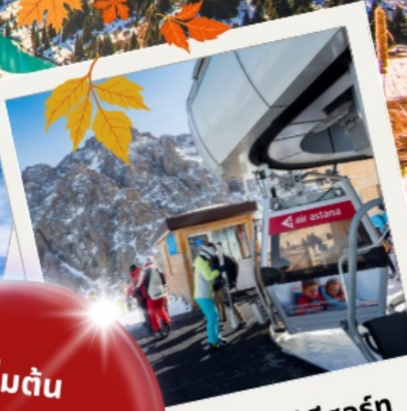
ซิมบูลิก สกี รีสอร์ท