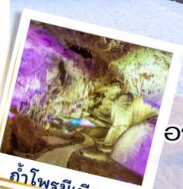
ถ้ำไฟรมีเทียส