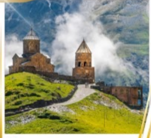
โบสถ์เกอร์เกติ