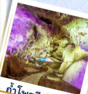
ถ้ำโพรมีเทียส