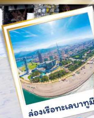
ล่องเรือทะเลบาตูมิ