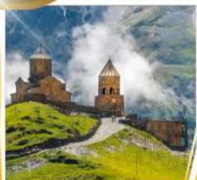
โบสถ์เกอร์เกตี