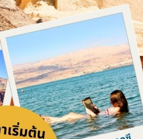
ทะเลสาบเดดซี