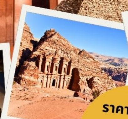
เพตรา นครศิลาสีชมพู