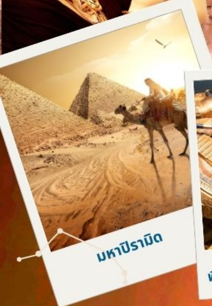
มหาปิรามิด