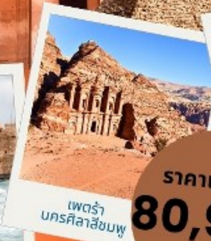
เพตรา นครศิลาสีชมพู