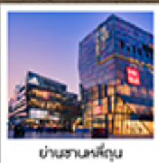
ย่านซานหลี่ตุ่น