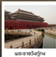
พระราชวังกู้กง