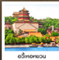
อวี๋เหอหยวน