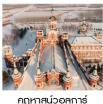
คฤหาสน์บอลการ์