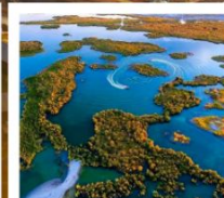
ทะเลสาบอูหลุนกู่

ผ่านทางด่วนทะเลทราย S21 / ทะเลสาบอูลุนกู่ / ปู่อ๋อจิน / เซาโปซา / กุ้งหญ้าอาเหอถังโก่ตี้ / หมู่บ้านเหมอู่ซุน / คานาสีอ / ทะเลสาบมังกรหลับ / ทะเลสาบเทวดา จุดชมวิวกานาสีอ / ศาลาชมปลา / ล่องเรือทะเลสาบคานาสีอ / หาดห้าสี / เมืองปีศาจ / เมืองคาลามาอี / คาลามาอี / แกรนด์แคนยอนตูซันจือ / ตลาดต้าปาจา