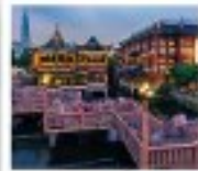
เจิ่งหวงเฉียว