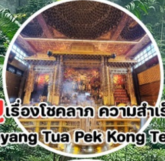
บู เรื่องโชคลาภ ความสำเร็จ Loyang Tua Pek Kong Temple