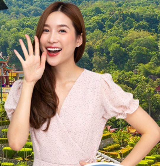
The Top KomTar