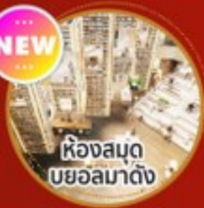
ห้องสมุด บยอลมาดิง