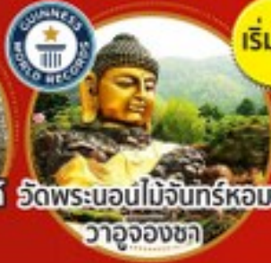
วัดพระนอนไม้จันทร์หอม วาจุงงซา