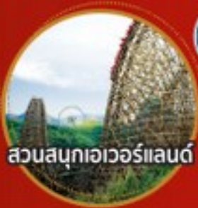
สวนสนุกเอเวอร์แลนด์