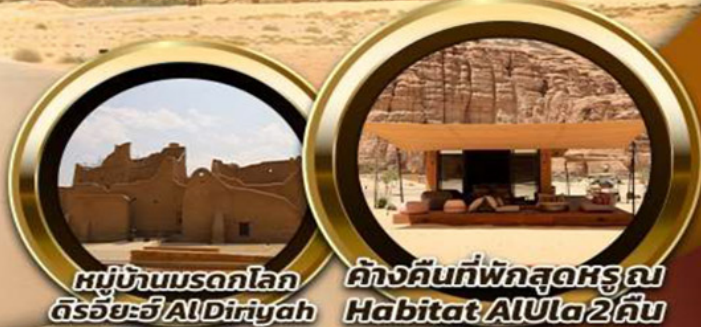
หมู่บ้านมรดกโลก ดิริยะฮ์ AlDiriyah

บินหรู อยู่สบาย เทียบชิด ชิด 10 ท่าน คอนเฟิร์มเดินทาง