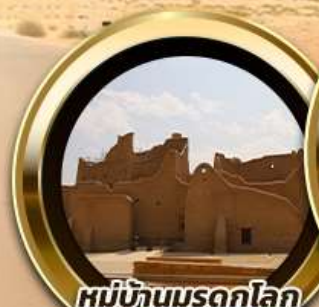
หมู่บ้านมรดกโลก ดิริยาห์ AlDiriyah

บินหรู อยู่สบาย เที่ยวบินดี ซิลด์ 10 ท่าน คอนเฟิร์มเดินทาง