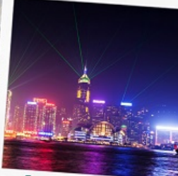
โชว์ SYMPHONY OF LIGHT