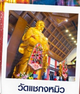
วัดเขากงหมิว