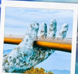
บาน่าฮิลล์