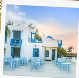
ซานตารีน่าคาเฟ่