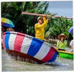
เรือกระดิง