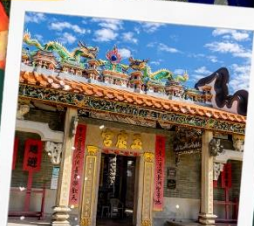
วัดปักไต้