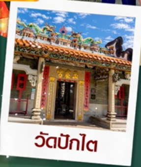
วัดปึกไต่