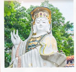
เจ้าแม่กวนอิมธิพลัสสมัย