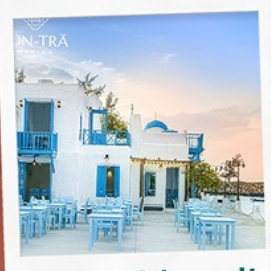
ซานตารีน้ำกาแฟ